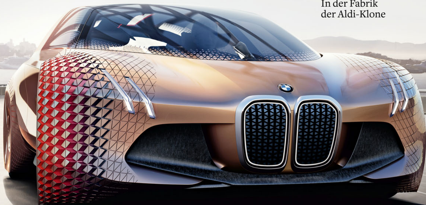
Schöner Traum: BMW's Vision Next